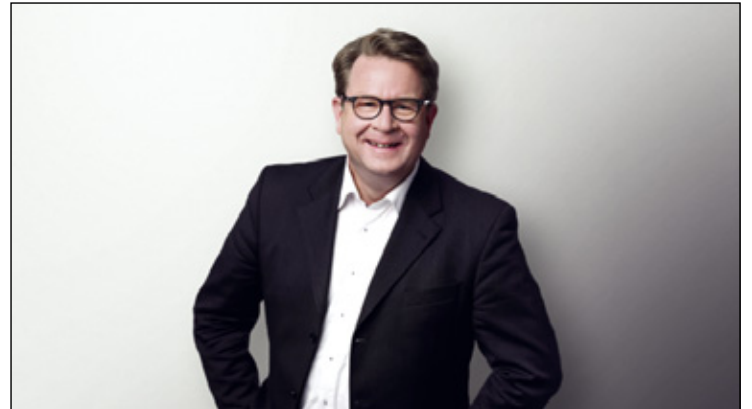
Carsten Müller, Mitglied des Deutschen Bundestags.