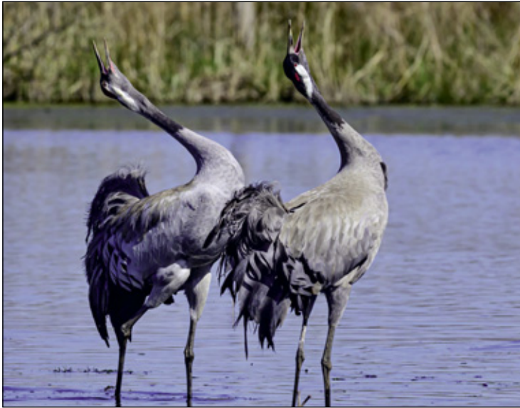
Nur die Kraniche konnten mit den Weißstörchen in unserer Region mithalten.

Obwohl wieder das ganze Frühjahr und den Frühsommer einige Männchen und ein Weibchen der Kolbenente im Gebiet waren, konnte leider wieder kein führendes Weibchen beobachtet werden. Dafür haben wir aber eine Reiherente mit ihren Jungen erst Mitte Juli sehen können. 14 (!) kleine und erst wenige Tage alte Küken schwammen hinter ihrer Mutter her. Zu späten Vogelarten, die ihre Jungen aufziehen, gehört der Neuntöter, der buschreiche, offene Landschaften bevorzugt und neben Insekten aller Art auch kleine Wirbeltiere jagt.