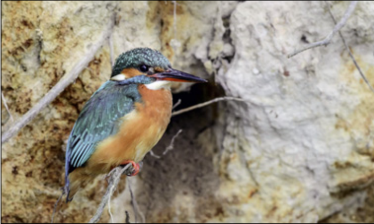
Der Eisvogel benötigt besonders viel Unterstützung bei der Brut.